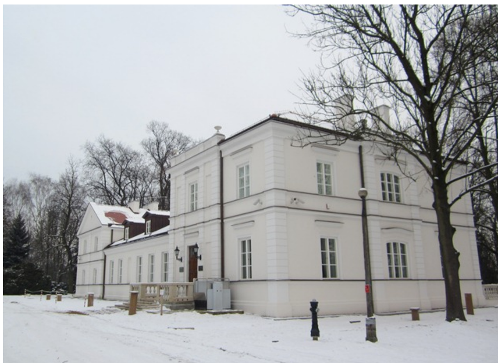
Fotografia 1. Dwór w Warce na Winiarach, obecnie Muzeum im. Kazimierza Pułaskiego

przydrożnych datowanych na XIX oraz XX w., oddających rustykalny charakter rozmieszczonych w gminie Warka miejscowości. Na ich tle wyróżniają się obiekty wpisane do rejestru zabytków.