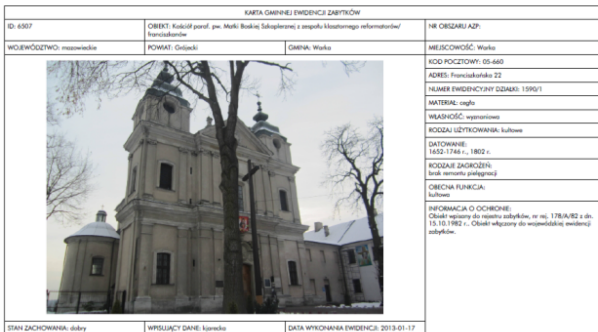
Rysunek 1. Wzór karty Gminnej Ewidencji Zabytków Gminy Warka

Karta ewidencyjna zabytku zawiera w szczególności dane umożliwiające określenie zabytku, jego miejsce położenia lub przechowywania, zwięzły opis cech i wartości kulturowych oraz wskazanie właściciela i posiadacza zabytku. Gminna ewidencja zabytków stanowi część wojewódzkiej ewidencji zabytków, która z kolei jest częścią krajowej ewidencji zabytków prowadzonej przez Generalnego Konserwatora Zabytków. Ewidencja zabytków jest podstawą do sporządzania programów opieki nad zabytkami przez województwa, powiaty i gminy. Gminna Ewidencja Zabytków Gminy Warka została przygotowana według specyfikacji przygotowanej przez Narodowy Instytut Dziedzictwa.